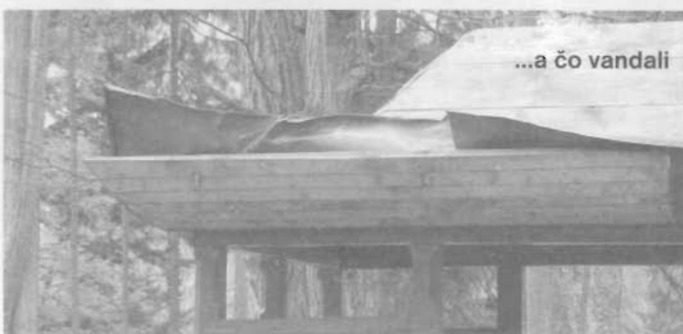
...a čo vandali