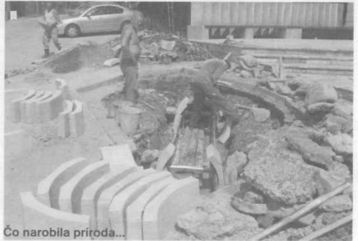
Čo narobila príroda...

obce vodu z lesov, rybníkov a parku. Pohľad to bol úchvatný, ale súčasne som si uvedomila, aké hrozné následky tento úkaz bude mať. - Privalová voda! Výraz, ktorý sa odrazu zhmotnil a ukázal v celej svojej sile. Voda bola všade! Zaliala cestu z ľavej strany potoka, valila sa pravou stranou, most bol riekou na poschodí, potok riekou v suteréne. Lávka pri evanjelickom kostole bola miestom, kde voda stekala po schodíkoch a potom do potoka. Vyzeralo to tak, že voda sa dostane i do MŠ a príľahlych budov okolo potoka, ale nakoniec si to odniesla len Hasičská strážnica. Všade pobehovali ľudia, hasiči sa zmobilizovali a utekali tam, kde boli potrební. Po pravej strane potoka sme zišli až k obecnému úradu, ale všade to bolo zlé! Už sa dali vidieť rany na murovanom opevnení brehov potoka, na hrádzach voda bublala popod asfalt na cestách a podmývala všetko, čo jej prišlo do cesty. Pochopila som, že voda má úžasnú silu, nič a nikto ju nezastaví. Oheň zahasiš vodou, ale vodu...? Vtedy ma len tak, na krátky okamih, napadla myšlienka - „čo by bolo, ak by sa roztrhla napr. priehrada na Dedinkách?“ Radšej takú myšlienku ihneď odvolal. Proste voda je neskrotný živel. Kým som sa ja vlastne rozplývala obdivom nad jej silou a vyčíňaním, vedenie našej obce konalo. Už o 16. hodine 28. júna 2006 zasadala Povodňová komisia OcÚ, ktorú zvolal starosta a súčasne jej predseda Július Farkašovský. Komisia, ktorú tvorilo 7 ľudí, vyhodnotila danú situáciu a od