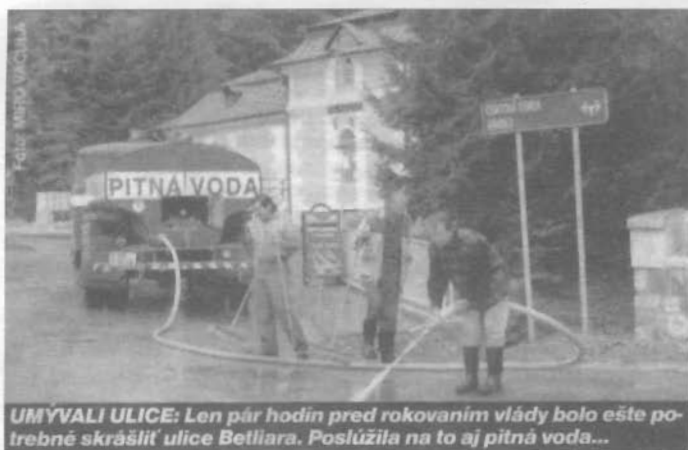
UMÝVALI ULICE: Len pár hodín pred rokoaním vlády bolo ešte potrebné skrášliť ulice Betliara. Poslúžila na to aj pitná voda...